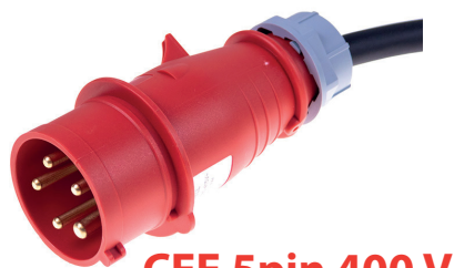
CEE 5pin 400 V