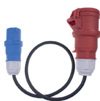
CEE 5pin 16A CEE 3pin 16A 230V 1m kempingová zásuvka