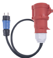
CEE 5pin 16A CZ SCHUKO 16A 230V 1m