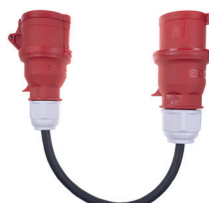
CEE 5pin 32A CEE 5pin 16A IP44