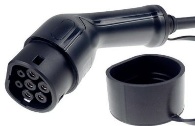
Mennekes Typ 2