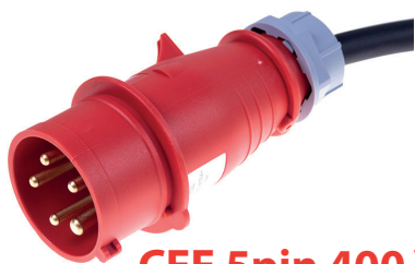
CEE 5pin 400 V